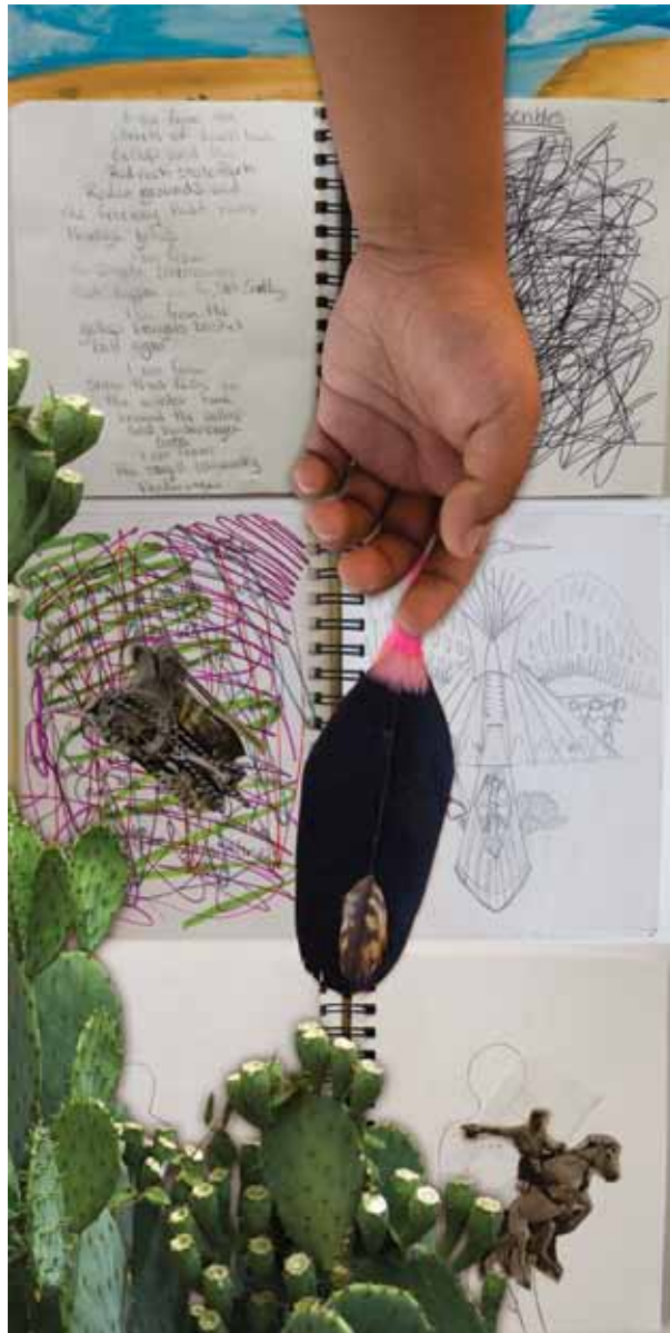
"I am from my brown 89' GMC Sierra pickup and my saddles and my ropes." "Soy de mi camioneta café de GMC Sierra '89 y de mis sillas de montar y mis cuerdas."