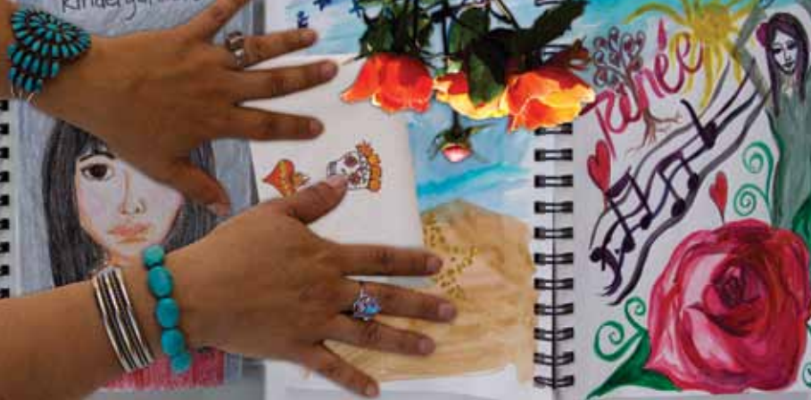
"I am from mulberry trees and yerba buena." "Soy de los morales y la hierba buena." Image/Imagen: Reneé Rubio, Chrissie Orr

S oy del SurValle valle del Río Grande el otro lado de las pistas.