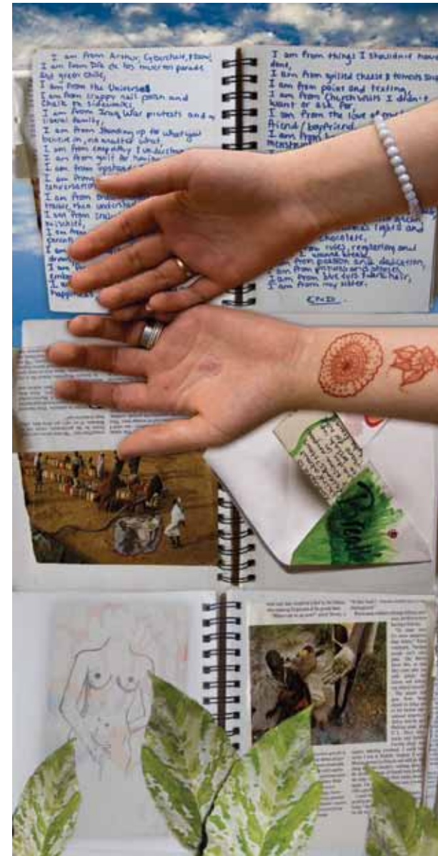
"I am from poetry and all night conversations." "Yo soy de la poesía y pláticas de toda la noche." Image/Imagen: Caitlyn Moppert, Chrissie Orr