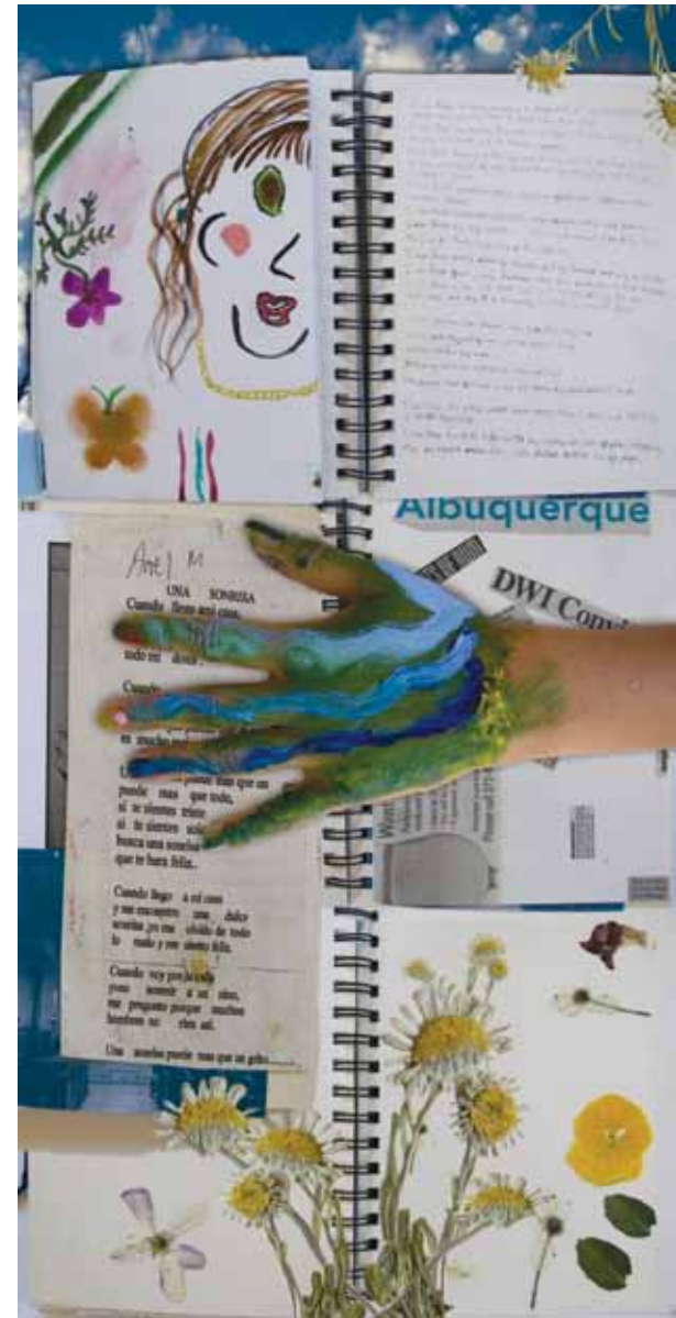
"I am from the glass houses where everything is new and nothing is to be touched." "Soy de las casas de cristal en que todo es nuevo yno se lo puede tocar." Image/Imagen: Ariel Maldonado, Chrissie Orr